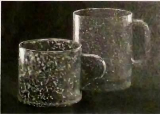
Typische Heutallbecher des Nachkriegszeit. Sie waren gefertigt aus Parsenmaterialien.

Ich habe einen mantel in die jackentasche zu stecken einen taschenmantel ich habe ein radio in die jackentasche zu stecken ein taschenradio ich habe eine bibel in die jackentasche zu stecken eine taschenbibel ich habe gar keine solche jacke mit taschen gar keine jackentasche ich habe eine schnapsflasche mit zwölf gläsern für mich und alle meine onkels und tanten ich habe eine kaffeekanne mit vier tassen für mich und meine drei besten freundinnen ich habe ein schachbrett mit schwarzen und weißen steinen für mich und einen freund ich habe gar keine freunde einzuladen niemanden ich habe einen himmel endlos über mir darunter mich wiederzufinden ich habe eine stadt voll straßen endlos darin mir zu begegnen ich habe ein lied endlos und endlos darin ein- und auszuatmen ich habe nicht mehr als ein gras zwischen zwei pflastersteinen nicht mehr zu leben