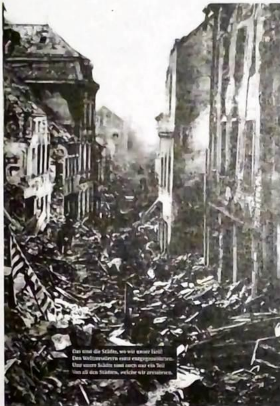
Das sind die Städte, wo wir unser Heil! Den Weltzerstörern einst entgegenlächelten. Und unsere Städte sind auch nur ein Teil Von all den Städten, welche wir zerstörten.

In den Jahren von 1938 bis 1946 verfasste Bertolt Brecht zahlreiche Text-Bild-Montagen, die er selbst als „Fotoepigramme“ bezeichnete. Dabei verwendete er authentisches Bildmaterial und verfasste dazu jeweils einen epigrammatischen Vierzeiler, der dieses Bild kommentierte. Die Buchausgabe dieser Epigramme erschien 1955 unter dem Titel „Kriegsäpfel“.