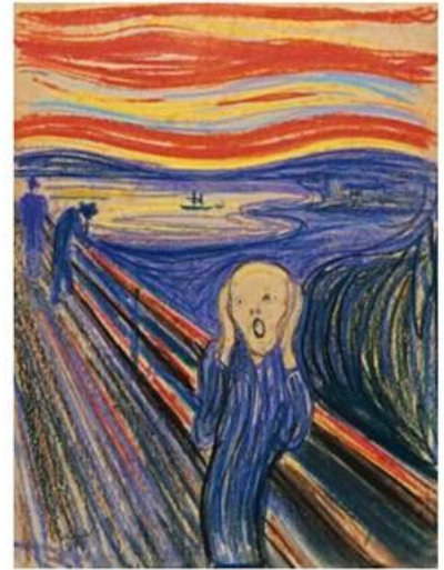
Edvard Munch: Der Schrei (1893)

Arbeitsweise: In dieser Unterrichtseinheit lernst du die Epoche des Expressionismus genauer kennen. Während der Arbeit herrscht bitte in der Klasse absolute Ruhe; es ist nur der Flüsterton erlaubt, damit sich jede/r gut konzentrieren kann. Ihr arbeitet während dieser Unterrichtseinheit in einer Dreiergruppe. Führe während der Beschäftigung mit diesem Thema ein Glossar, in dem du für dich neue Fachbegriffe und ihre Erklärung notierst. Die Epoche ist geprägt durch die Werke junger Autor:innen, ich hoffe, dass das Thema für dich interessant wird. Fleißige/begabte Schüler:innen können zusätzliche Werke auf den Seiten 300- 335 oder „Brief an den Vater“ von Kafka als Ganztext lesen. https://www.projekt-gutenberg.org/kafka/vater/vater.html